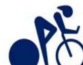
Ciclismo de pista