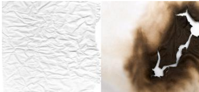
O papel amassado e o papel queimado são, respectivamente, uma transformação física e outra química

A matéria pode passar por transformações físicas e químicas. As transformações físicas não alteram a composição da matéria. Um exemplo é quando amassamos o papel, ele continua sendo papel, apenas sua forma mudou. Já as transformações químicas alteram a composição da matéria, ou seja, as partículas do material, que estavam ligadas umas com os outras de uma forma, trocam de lugar e formam novas substâncias. É o que acontece quando queimamos o papel.