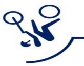
Ciclismo BMX Freestyle