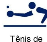
Tênis de mesa