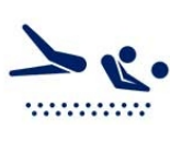
Volei de praia