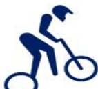
Ciclismo BMX corrida