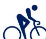
Ciclismo de estrada