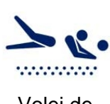
Volei de praia

Agora que você já sabe quais são as modalidades dos Jogos Olímpicos anote abaixo quais delas você não conhece.