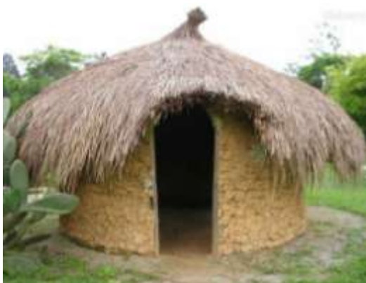
CASA DOS ÍNDIOS - OCA

CONVERSAR COM A CRIANÇA SOBRE A CASA ONDE MORA, QUE MATERIAL FOI USADO PARA A CONSTRUÇÃO. EM SEGUIDA FAZER UMA EXPLICAÇÃO E MOSTRAR AS IMAGENS ABAIXO DOS TIPOS DE MORADIAS QUE EXISTEM.