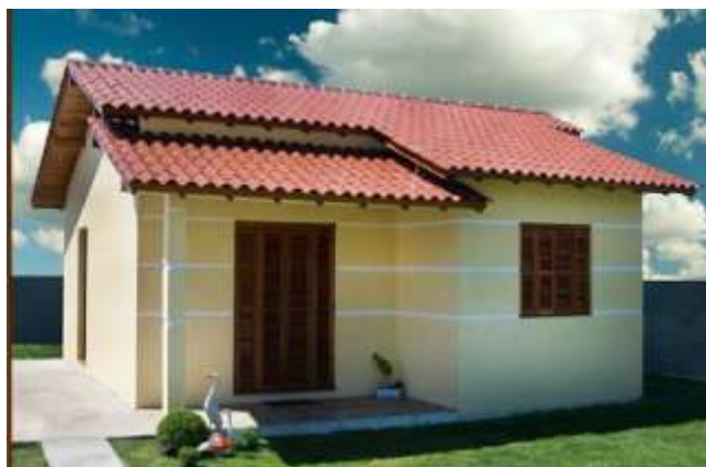
CASA DE ALVENARIA/TIJOLOS