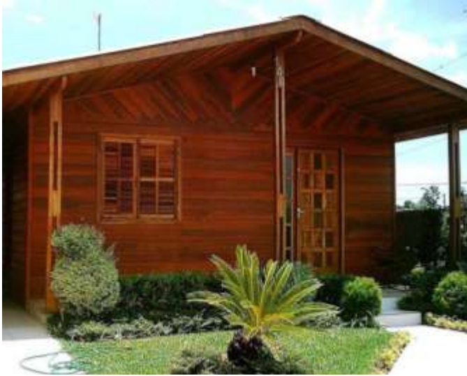
CASA DE MADEIRA