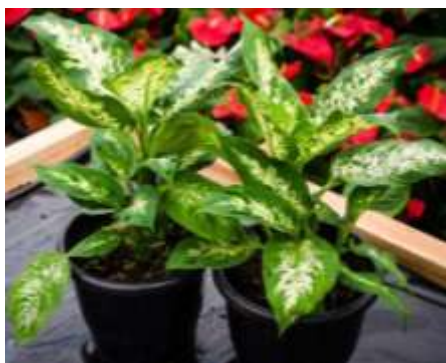
COMIGO NINGUÉM PODE

OBSERVE ABAIXO ALGUMAS PLANTAS QUE NÃO SÃO COMESTÍVEIS: