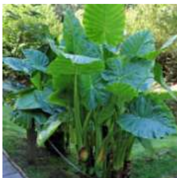
LÍRIO DA PAZ