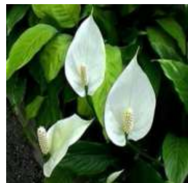
ORELHA DE ELEFANTE